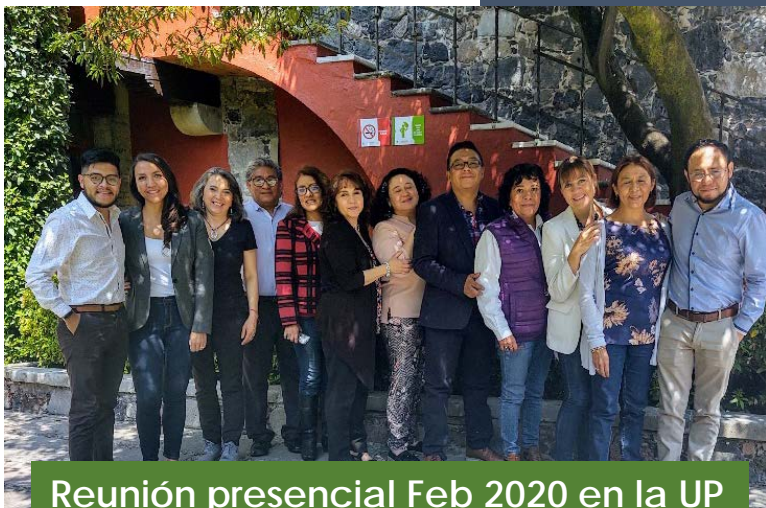
Reunión presencial Feb 2020 en la UP